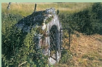
Puits couvert de Pradaget