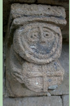
Détail d'un modillon