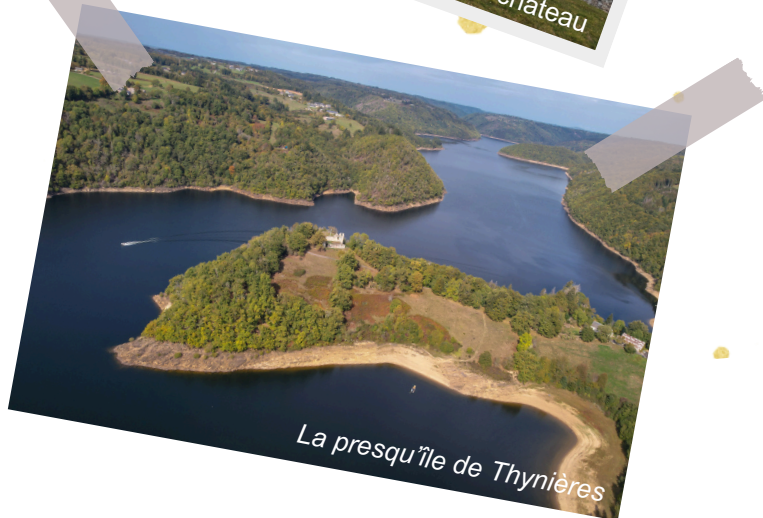
La presqu'île de Thynières