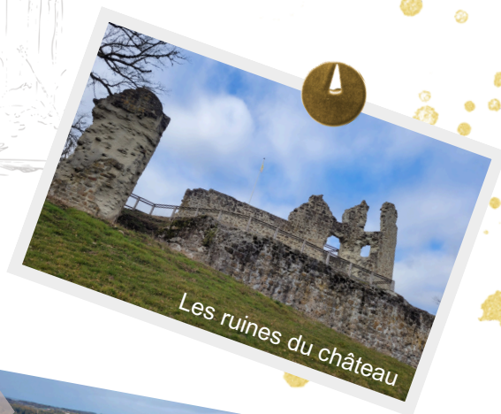
Les ruines du château