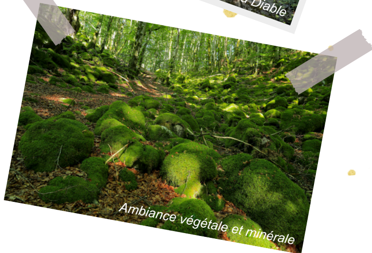
Ambiance végétale et minérale