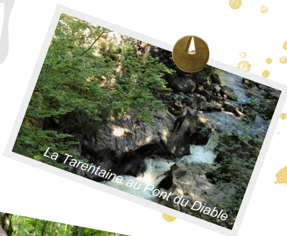
La Tarentaine au Pont du Diable

La forêt de Gravières s'étend sur 600 hectares. Elle fut autrefois exploitée par une scierie installée sur le domaine du même nom. Cette dernière employa jusqu'à une centaine de personnes avant d'être incendiée pendant la seconde guerre mondiale. Reconstituée, elle fut par la suite abandonnée.