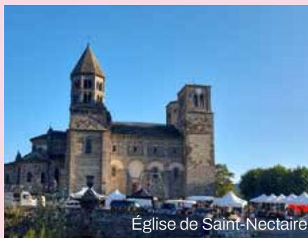
Église de Saint-Nectaire

Concerts, animations, artisanat, food-truck. 17h30 : idéambulation de cirque burlesque -18h30 : rencontre avec Tibou -19h30 : concert ACCORDÉMON (Cumbia Musette).