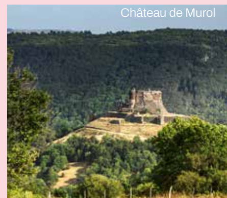
Château de Murol