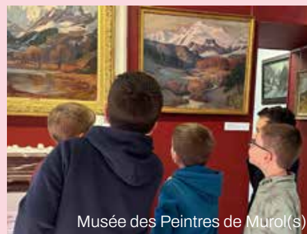
Musée des Peintres de Murol(s)

Plongez au cœur de l'univers des peintres de l'École de Murol(s) et laissez-vous transporter dans un escape game captivant pour vivre une expérience unique. À partir de 8 ans.