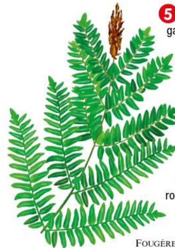
FOUGÈRE OSMONDE ROYALE / DESSIN PR.

4 Continuer tout droit. 1 km plus loin, laisser l'impasse de la Croze à gauche, puis la route de la Bouble à droite, et prendre la route à droite (direction La Suchère).