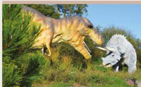
PARC PALÉOPOLIS

Paléopolis propose une exposition permanente de 600 m 2 , des expositions