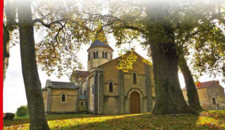
ÉGLISE DE BIOZAT

5 Virer à gauche pour rejoindre l'église de Charmales.