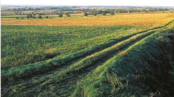
CHEMIN DE PLAINE, CHARMES

de riches cultures, où chaque saison apporte sa note de tableaux colorés : la terre des labours, le jaune du tournesol et du colza, le blond des blés, ou le vert soutenu du maïs.