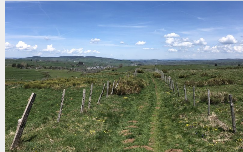
chemin à travers pâturages (@sagnes)