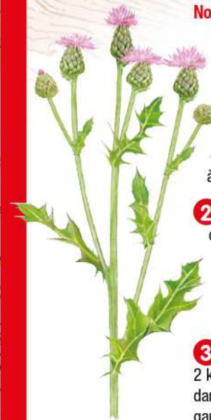
CIRSIS DES CHAMPS DESSIN P.R.

Non loin du vallon verdoyant de la Bouble, cette balade autour de Monestier relie les forêts domaniales de Giverzat et de Monestier et offre, en chemin, de larges perspectives.