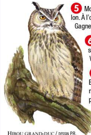
HIBOU GRAND-DUC / DESSIN P.R.

4 Juste après la clairière, descendre à gauche dans le bois. Peu après, à la patte d'oie, prendre à gauche le chemin en balcon. Emprunter le chemin à droite. À l'intersection de trois chemins, partir à gauche. Couper la D 42 puis la D 66 et poursuivre par la route qui longe la Sioule. Ne pas franchir le pont, mais se diriger vers le moulin Parraut. À la patte d'oie, choisir le chemin de droite et gagner l'emplacement qu'occupait jadis le moulin Parraut.