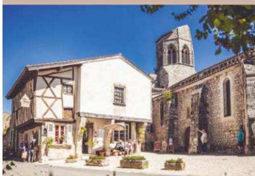
MAISON À COLOMBAGES ET ÉGLISE DE CHARROUX

D u haut de son plateau, Charroux domine la grande plaine bouronnaise qui se perd dans les lointains.