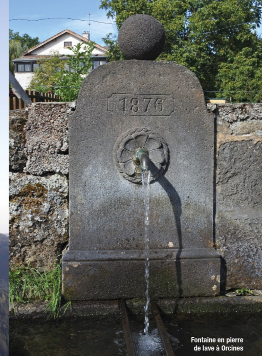
Fontaine en pierre de lave à Orcines