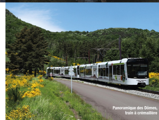
Panoramique des Dômes, train à crémaillère