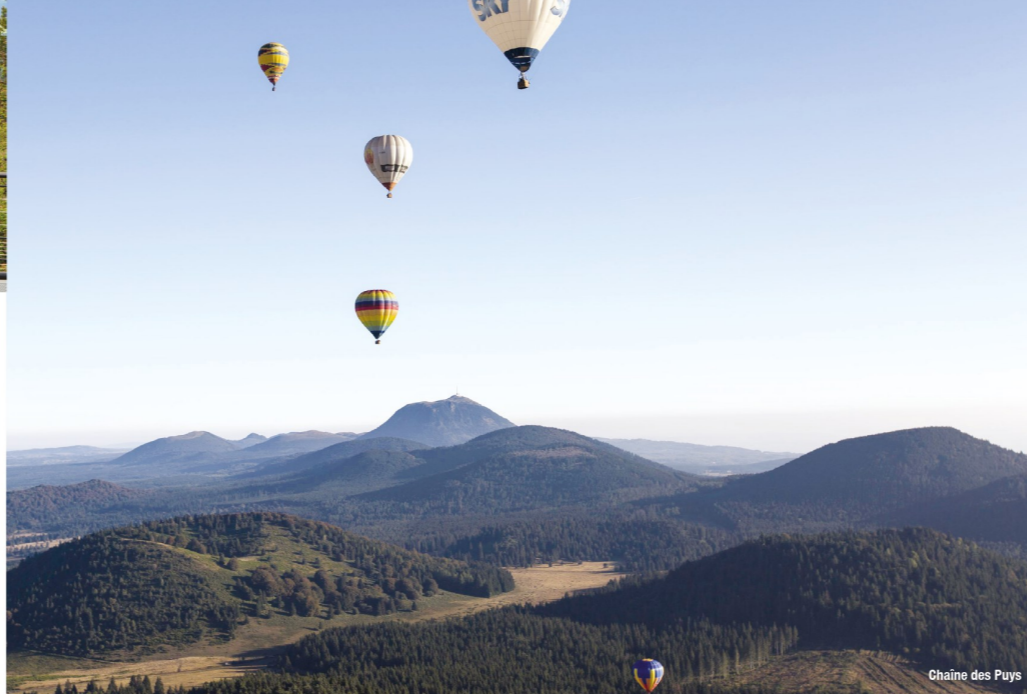
Chaîne des Puys

Découvrez la formule « Rando confort » avec accompagnement sur chaque étape en pension complète.